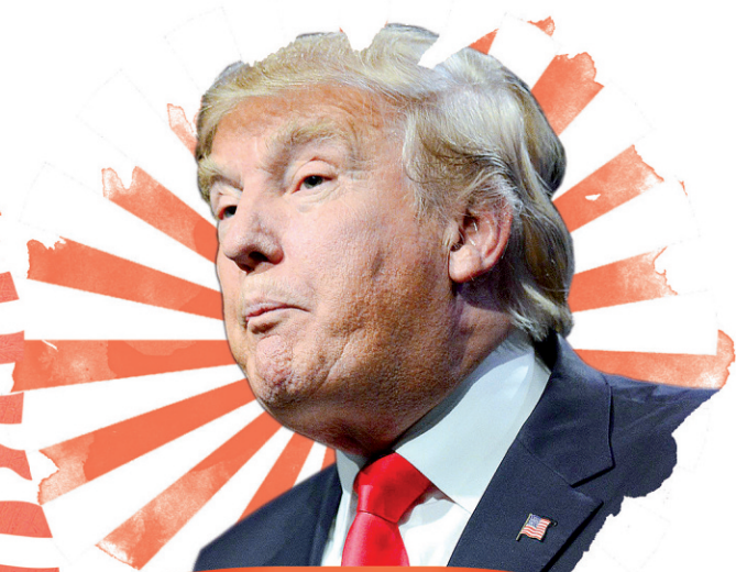
Donald John Trump