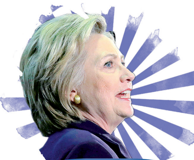
Hillary Diane Rodham Clinton